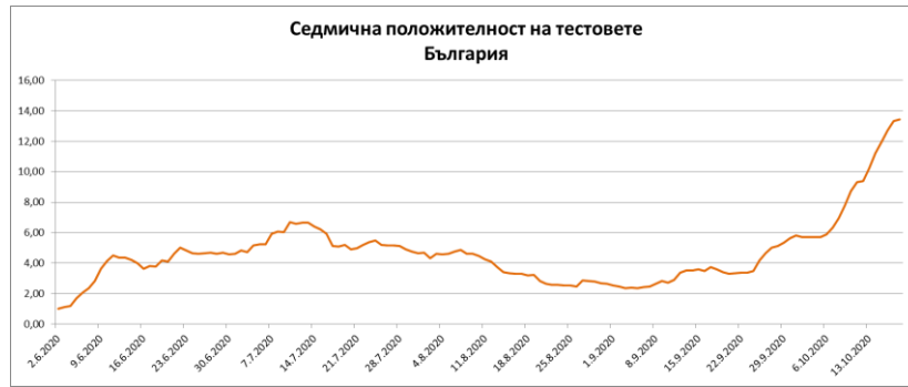
Фиг. 2: Седмична положителност на извършените PCR тестове

Тревожна е и тенденцията за нарастване на броя на лицата с COVID-19, при които се налага лечение в лечебно заведение за болнична помощ, както и на пациентите, нуждаещи се от интензивни грижи и реанимация, поради влошаване на здравословното им състояние и настъпили усложнение, вследствие на новия коронавирус – Фиг. 4.