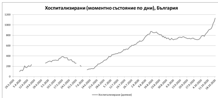
Фиг. 4: Брой на хоспитализираните с COVID-19 в България

Тревожна е и тенденцията за нарастване на броя на лицата с COVID-19, при които се налага лечение в лечебно заведение за болнична помощ, както и на пациентите, нуждаещи се от интензивни грижи и реанимация, поради влошаване на здравословното им състояние и настъпили усложнение, вследствие на новия коронавирус – Фиг. 4.