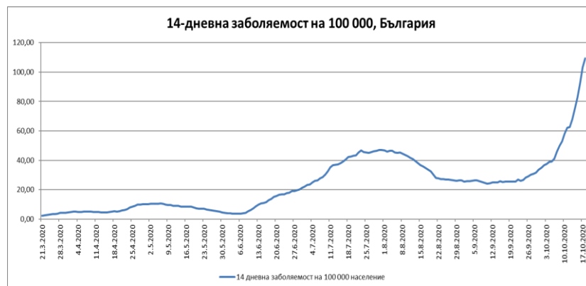
Фиг. 1: 14-дневна заболяемост на 100 000 население, България

От анализа на разпространението на заболяването по области (Фиг. 2) е видно, че към 18.10.2020 г. тринадесет области са с 14-дневна заболяемост в рамките на 60-119.9 на 100 000 души население (оцветени в оранжево), а шест области са със заболяемост над 120 на 100 000 души население (Благоевград, Габрово, Сливен, София-град, Търговище и Шумен) – оцветени в червено.